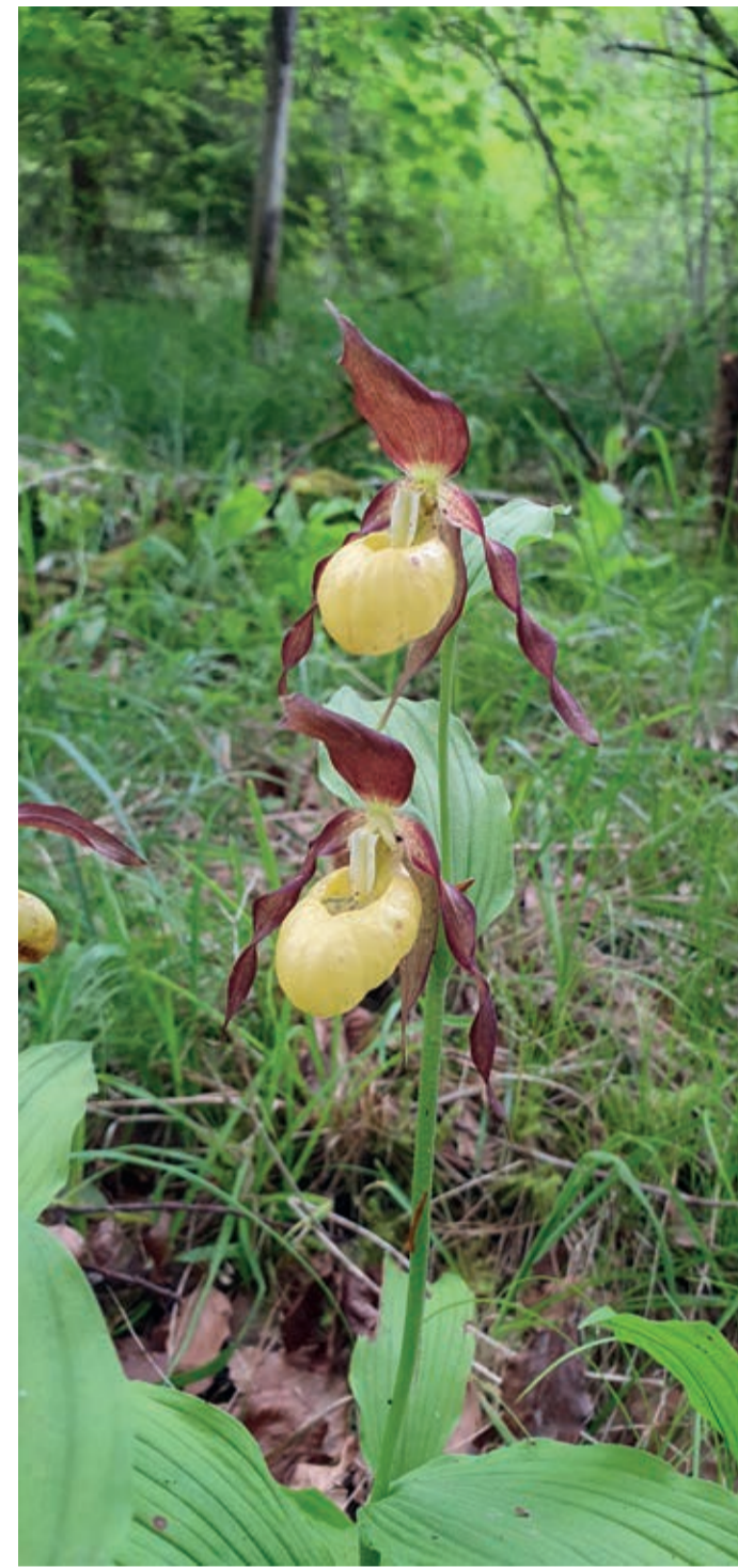
Sabots de Vénus

GEMEAUX ↔ 3 km | ☉ 1 h 15 Descriptif p.24 du guide Découvrir en s'amusant