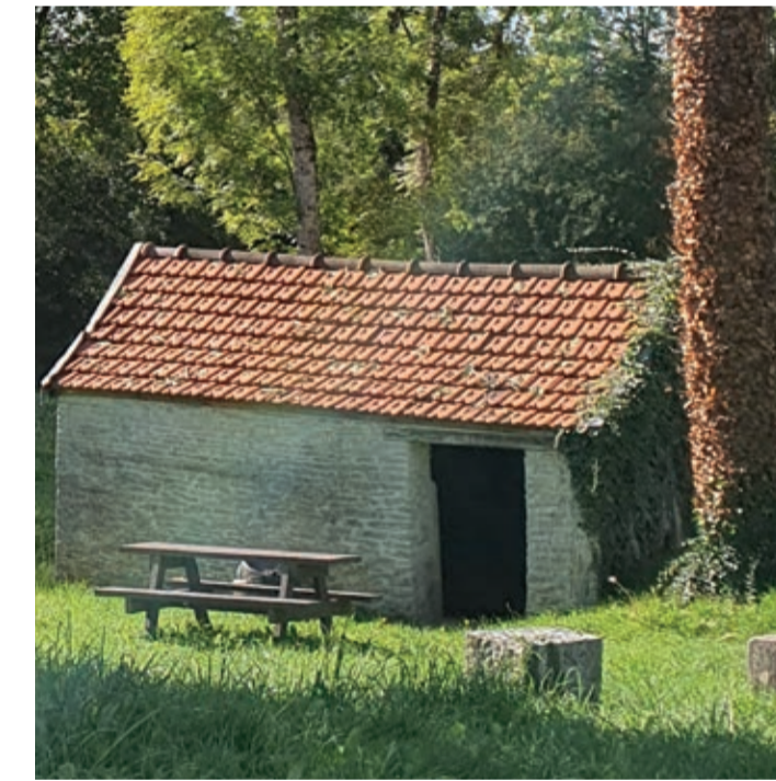
Lavoir de Crecey-sur-Tille