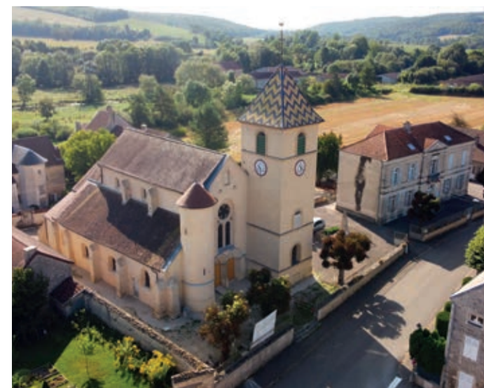
Église de Marey-sur-Tille

POISEUL-LÈS-SAULX ↔ 0,8 km | ☉ 40 min Descriptif p.16 du guide Découvrir en s'amusant